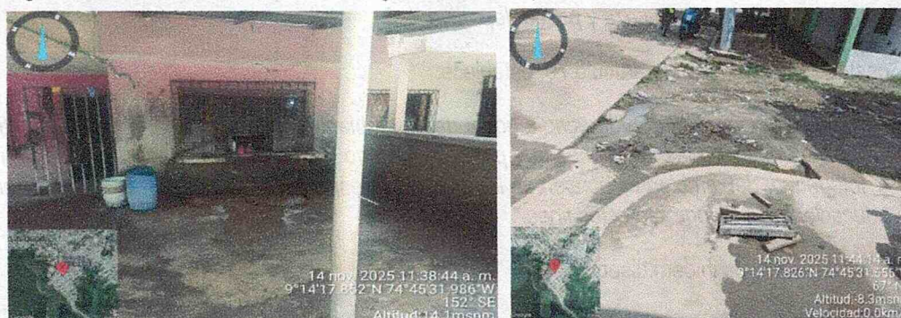
Figura 5 y 6. Vertimiento y trampas de sólidos sedimentables.