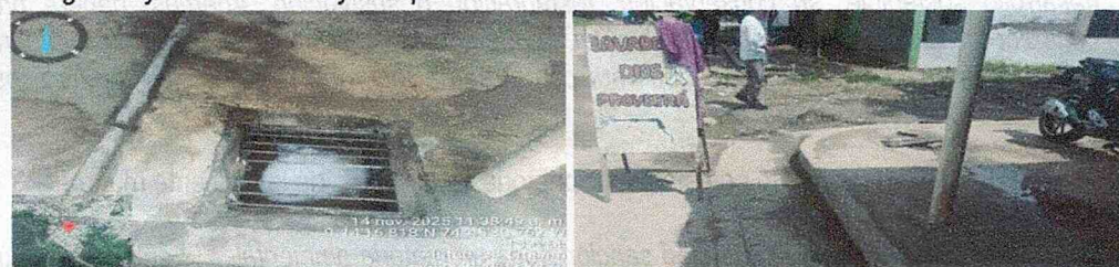
Figura 7 y 8. Vertimientos de viviendas vecinas y escurrimiento al área de lavadero.