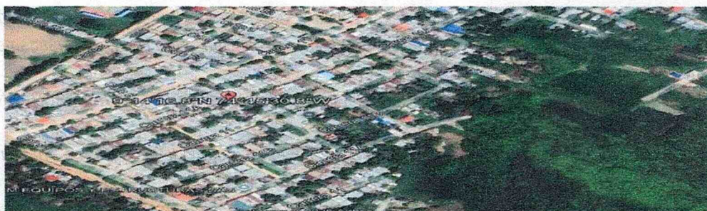
Figura N. º 1. Lavadero "Dios proveerá"